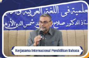
Kerjasama Internasional Pendidikan Bahasa