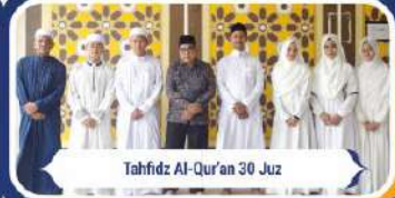
Tahfidz Al-Qur'an 30 Juz