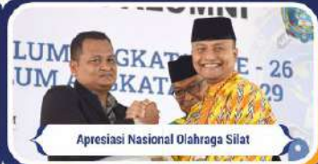
Apresiasi Nasional Olahraga Silat