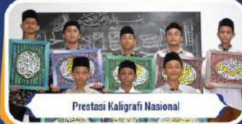
Prestasi Kaligrafi Nasional