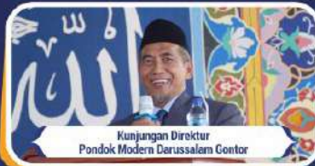
Kunjungan Direktur Pondok Modern Darussalam Gontor