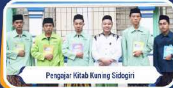
Pengajar Kitab Kuning Sidogiri