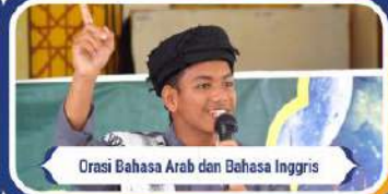
Orasi Bahasa Arab dan Bahasa Inggris